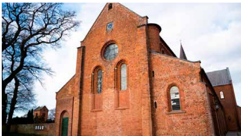
Kirkerne i Mørkøvs sogneudflugt besøger bl.a. Sorø Klosterkirke

Mænd mødes til en kop kaffe med brød og en god snak. Det er hyggeligt og kun for mænd. Vel mødt! Ældresagen og menighedsrådet i Jyderup.