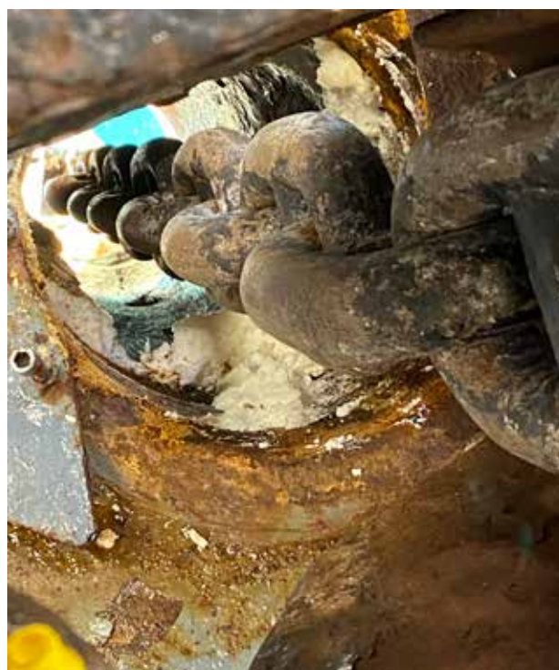
Et anker holder fast. Hvordan stemmer det med, at det er et symbol for håbet?

Jeg er orlogspræst (OPR), dvs. præst i Søværnet, og min opgave er at besøge besætningerne til søs og sejle med i kortere eller længere tid. Denne gang, i september 2022, blev det tre uger ombord på TRITON sammen med en stambesætning, en gruppe værnepligtige og et hold kadetter (nyuddannede søofficerer).