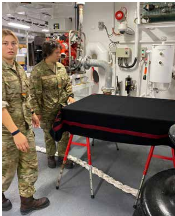
De værnepligtige hjælper med at rigge til, når der skal være gudstjeneste på fortojningsdækket.

”Vi” er besætningen på inspektionsskibet TRITON, et af Søværnets fire isforstærkede skibe, som patruljerer ved Færøerne og Grønland døgnet rundt, året rundt. De hævder kongerigets suverænitet og løser andre militære og civile opgaver.