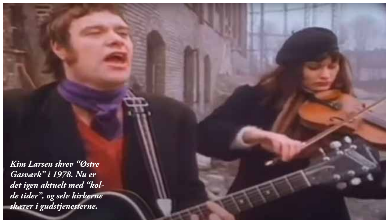
Kim Larsen skrev ”Østre Gasværk” i 1978. Nu er det igen aktuelt med ”kolde tider”, og selv kirkerne skærer i gudstjenesterne.

Men vi slukker ikke for det hele. Lys og varme må der til, for vi kommer jo i kirken for at få tændt åndens lys og varme ved ham, der bliver svøbt og lagt i en krybbe i den kølige julenat. Gud, der blev menneske – et menneske med brug for lys og varme som alle os andre. Ånd og kød kan ikke skilles ad i denne verden. Og vi håber, at åndens lys og varme må strømme fra julens evangelium ud i vores såre menneskelige liv med hinanden.