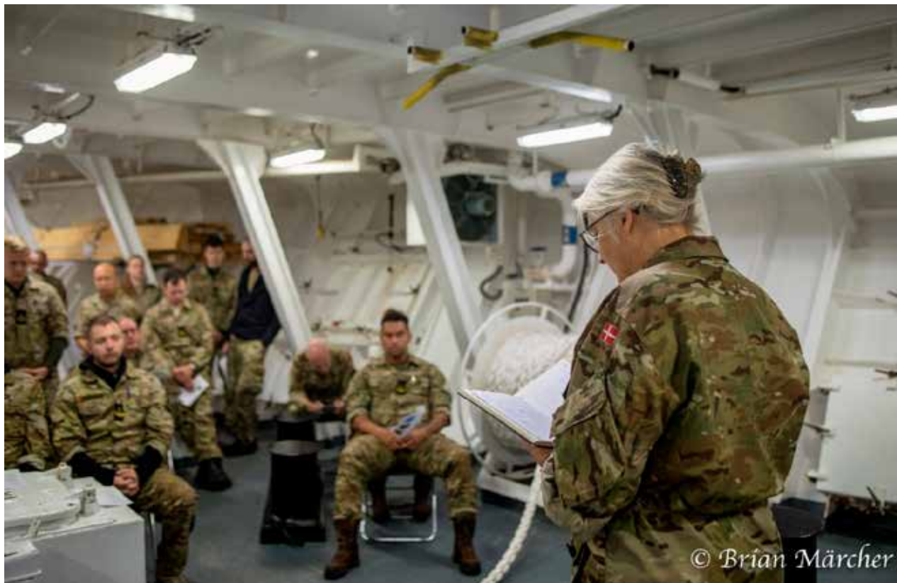
Der holdes gudstjeneste ombord på inspektionsskibet TRITON, mens det patruljerer ved Færøerne og Grønland.

”Må jeg hjælpe med at dele brød ud?” spørger en ung værnepligtig – det er ikke mange år siden, hun var konfirmand. Skønt er det at møde deres hjælpsomhed og den selvfølge, de forventer en gudstjeneste med.