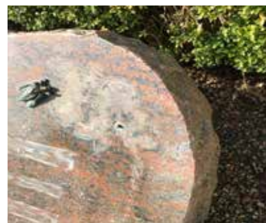
En blomst af kobber er fjernet fra denne gravsten. Graverne kan vejlede om, hvad man skal gøre.