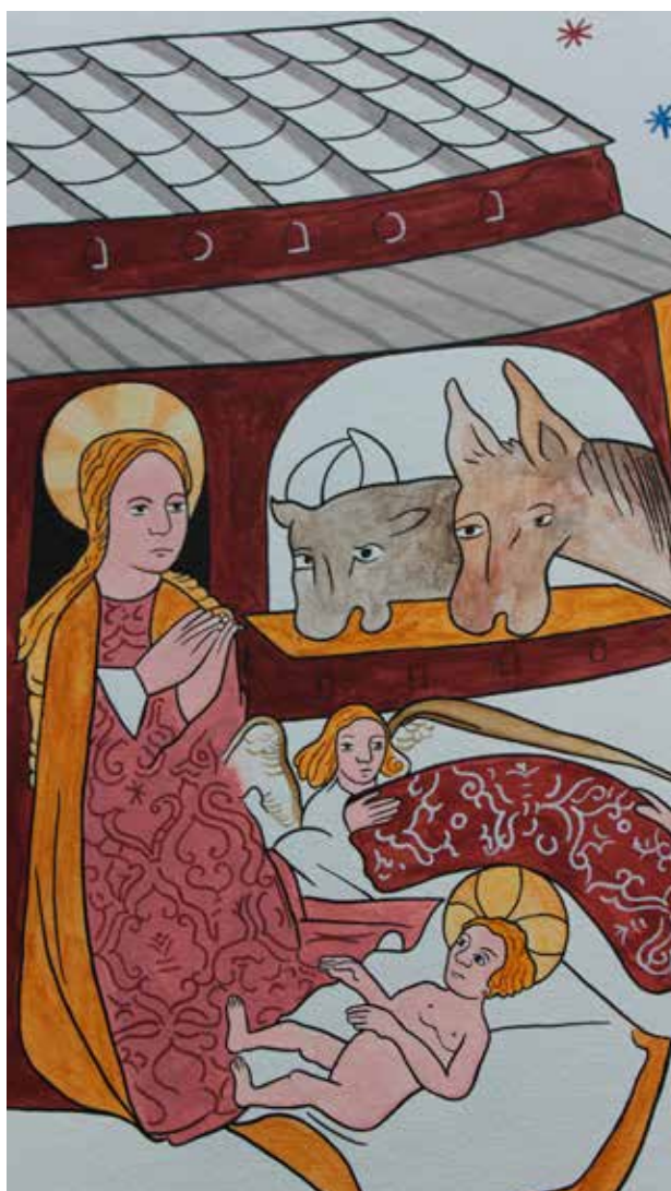
Fødslen i Betlehem. Udsnit af Claus Jørgensen Muldstrups genmaling af kalkmaleri i Hjembæk Kirke.