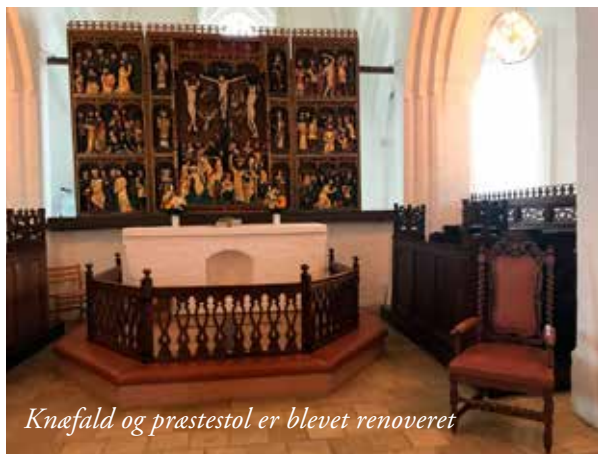
Knæfald og præstestol er blevet renoveret

Menigheden kan nu glæde sig over nye, grønne hynder, som er lagt på alle bænke. Den lyse og indbydende farve har givet en flot samhørighed med det øvrige inventar i kirken. Samtidig er knæfald og præstestol renoveret, hvilket også giver en helhed omkring alteret.