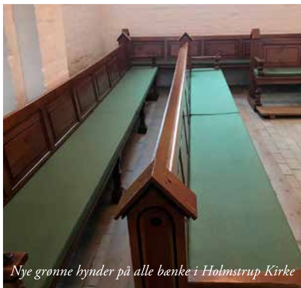
Nye grønne hynder på alle bænke i Holmstrup Kirke