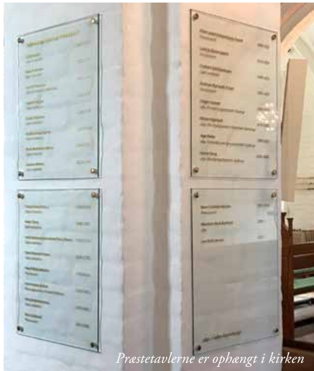
Præstetavlerne er ophængt i kirken

Der skulle også findes en god placering, som ikke måtte skade den historiske bygning, men som samtidig skulle placeres til oplysning for besøgende og menighed. Tavlerne er nu placeret lige indenfor i kirken, og på dem kan man læse præstehistorik fra før reformationen og op til i dag.