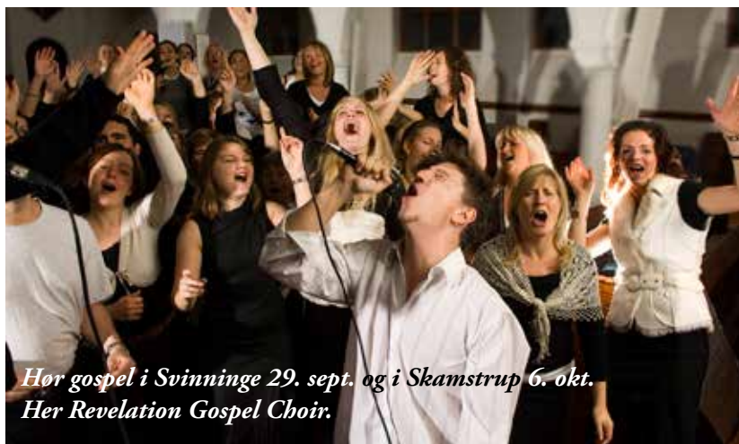
Hør gospel i Svinninge 29. sept. og i Skamstrup 6. okt. Her Revelation Gospel Choir.

Læs mere om dette arrangement i boksen på side 7.